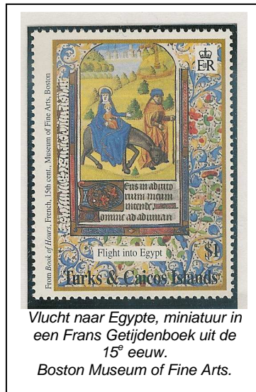
Vlucht naar Egypte, miniatuur in een Frans Getijdenboek uit de 15 e eeuw. Boston Museum of Fine Arts.

De reiskosten ed. en de entreprijzen voor de excursies worden door elk lid zelf betaald. Hierbij komt de museumkaart telkens goed van pas.